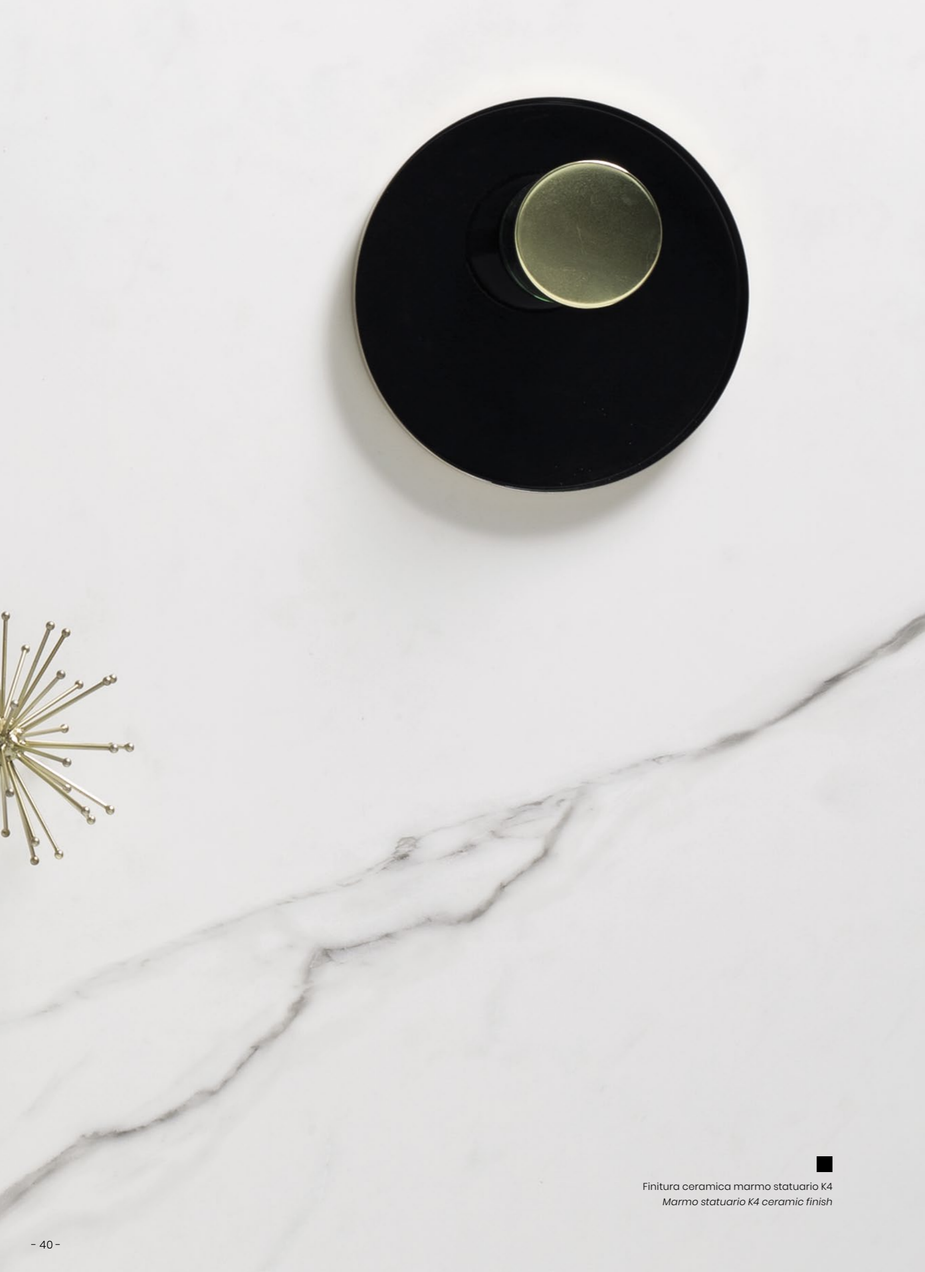
■ Finitura ceramica marmo statuario K4 Marmo statuario K4 ceramic finish